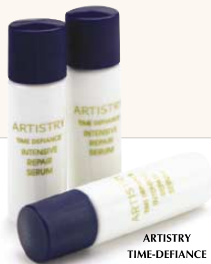
ARTISTRY TIME-DEFIANCE Serum intensywnie regenerujące (NR KAT. 100282)

Ponieważ w czasie snu cały organizm się regeneruje. Zastosowanie serum na noc dodatkowo uaktywnia procesy regeneracyjne skóry. Dzięki temu skóra szybciej i skuteczniej odnowi się po zniszczeniach spowodowanych w ciągu dnia przez czynniki zewnętrzne. Dodatkowo serum zabezpiecza skórę przed dalszym starzeniem się.